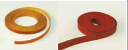
Ruban de Téflon®