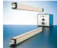
Barres de soudures avec résistances spécifiques

• Pièces détachées : Nous vous proposons de nombreux éléments de construction et consommables tels que des barres de soudures, des générateurs d'impulsions, des câbles de connexion, des résistances, des revêtements spéciaux, du Téflon®, etc... N'hésitez donc pas à nous soumettre tous vos problèmes de soudure.