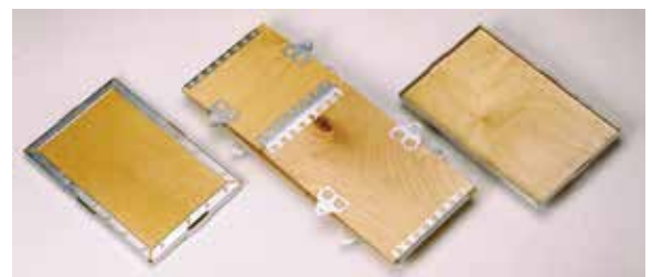
ExPak est livré à plat