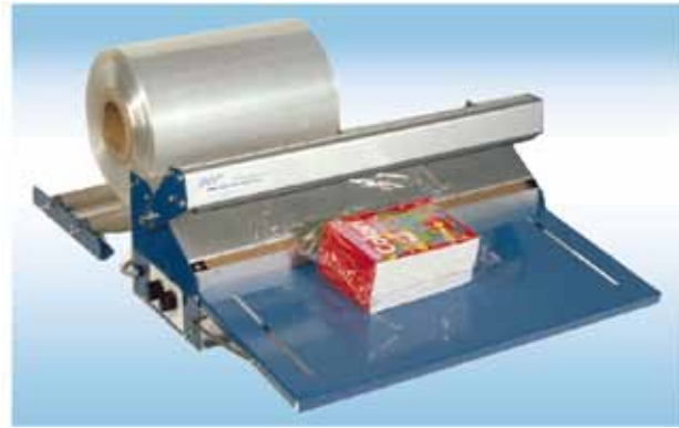
Soudeuse SMS présentée avec les options tablette et dérouleur de gaine

La soudeuse SMS existe également en version Inox.