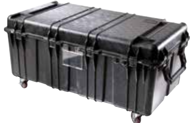
illustration avec roulettes optionnelles

DIMENSIONS INT.: 120.8 x 61.1 x 44.9 cm (47.57" x 24.07" x 17.68") DIMENSIONS EXT.: 129.7 x 70 x 57.9 cm (51.05" x 27.54" x 22.79") PROF. COUVERCLE/FOND: 8.1 cm / 36.8 cm (3.19" / 14.49") POIDS: 43.09 kg (95 lbs) AVEC MOUSSE 35.92 kg (79.2 lbs) SANS MOUSSE ■