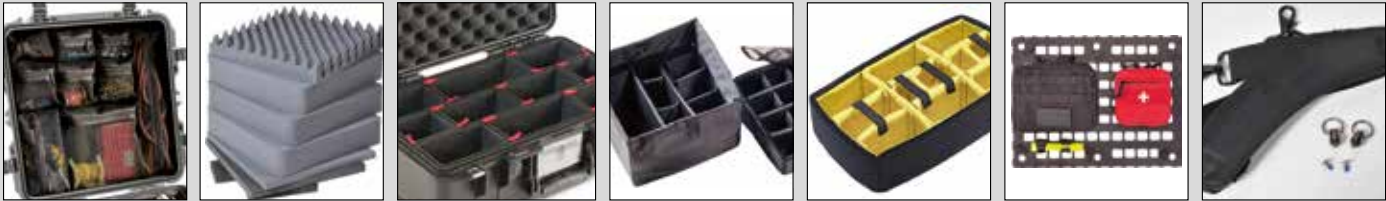
Pochettes couvercle Rechange Mousse haute densité prédécoupée Cloisons TrekPak™ Cloisons rembourrées Cloisons rembourrés jaunes Panneau Molle EZ-Click Bandoulières

Pour connaître les accessoires spécifiques disponibles pour chaque modèle de valise, rendez-vous sur www.peli.com .